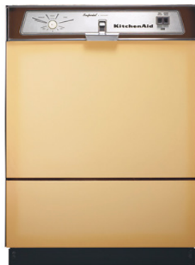
PHOTO DU LAVE- VAISSELLE KD-10 LANCÉ PAR KITCHENAID EN 1949 1 . DISPOSANT D'UNE TECHNOLOGIE RÉVOLUTIONNAIRE, NOS LAVE-VAISSELLES AUJOURD'HUI NE SONT PAS BIEN DIFFÉRENTS.

LORS DE L'EXPOSITION UNIVERSELLE DE 1893, PLUSIEURS MACHINES FURENT EXPOSÉES 1,2 . VICTIMES DE LEUR SUCCÈS, ELLES FURENT TOUTES VENDUES ENTRE 700 ET 1000 DOLLARS ET UTILISÉES DANS DES RESTAURANTS AINSI QUE DES HÔTELS DE LUXE 1 .